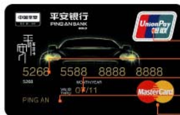
万事达双币卡正面