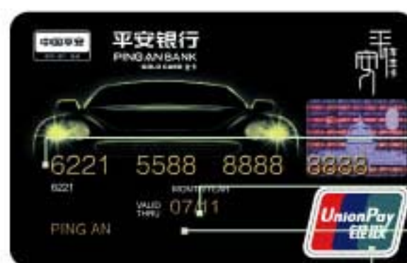
银联人民币卡正面