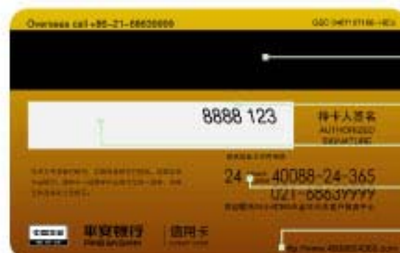
银联人民币卡背面