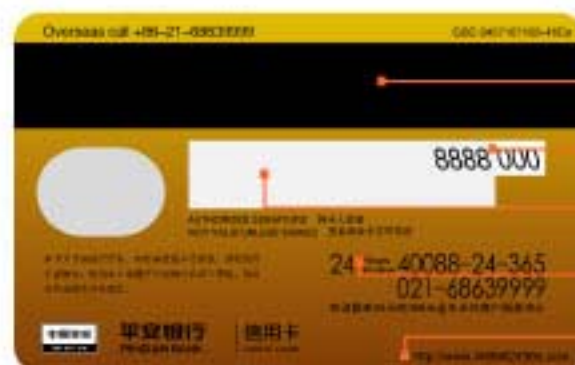
万事达双币卡背面