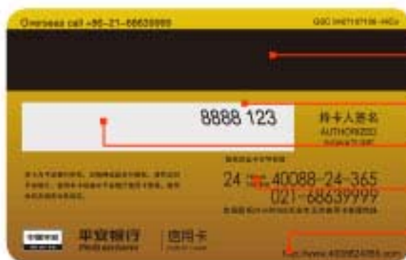
银联人民币卡背面