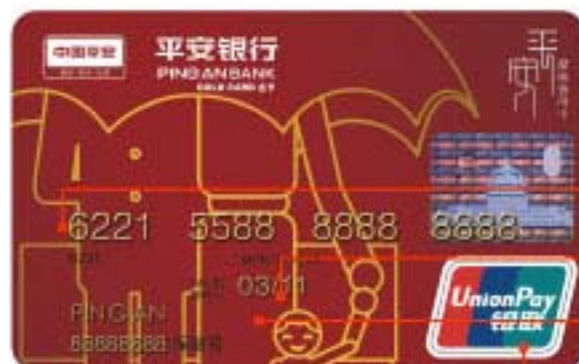
银联人民币卡正面